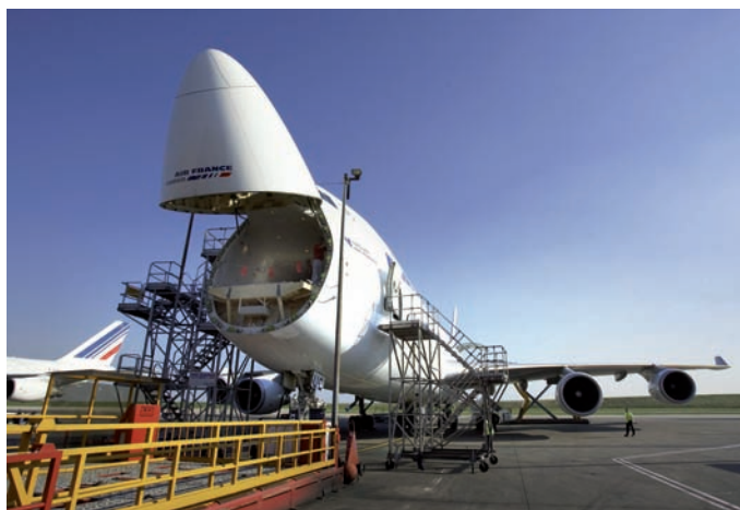
El primer embarque aéreo sin papeles partió el pasado 16 de marzo desde Barcelona con destino al Aeropuerto de Toulouse.

Tiba Internacional es una de las transitarías que desde el primer momento mostró su interés en el desarrollo de esta iniciativa en España. De hecho, ya ha realizado un buen número de envíos desde el Aeropuerto de Madrid en colaboración con Iberia, y ahora planea hacer lo propio en los aero-